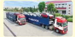
GIAO NHẬN VẬN CHUYỂN Ô TÔ, XE MÁY