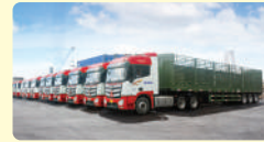
VẬN CHUYỂN GIA SÚC (BÒ)