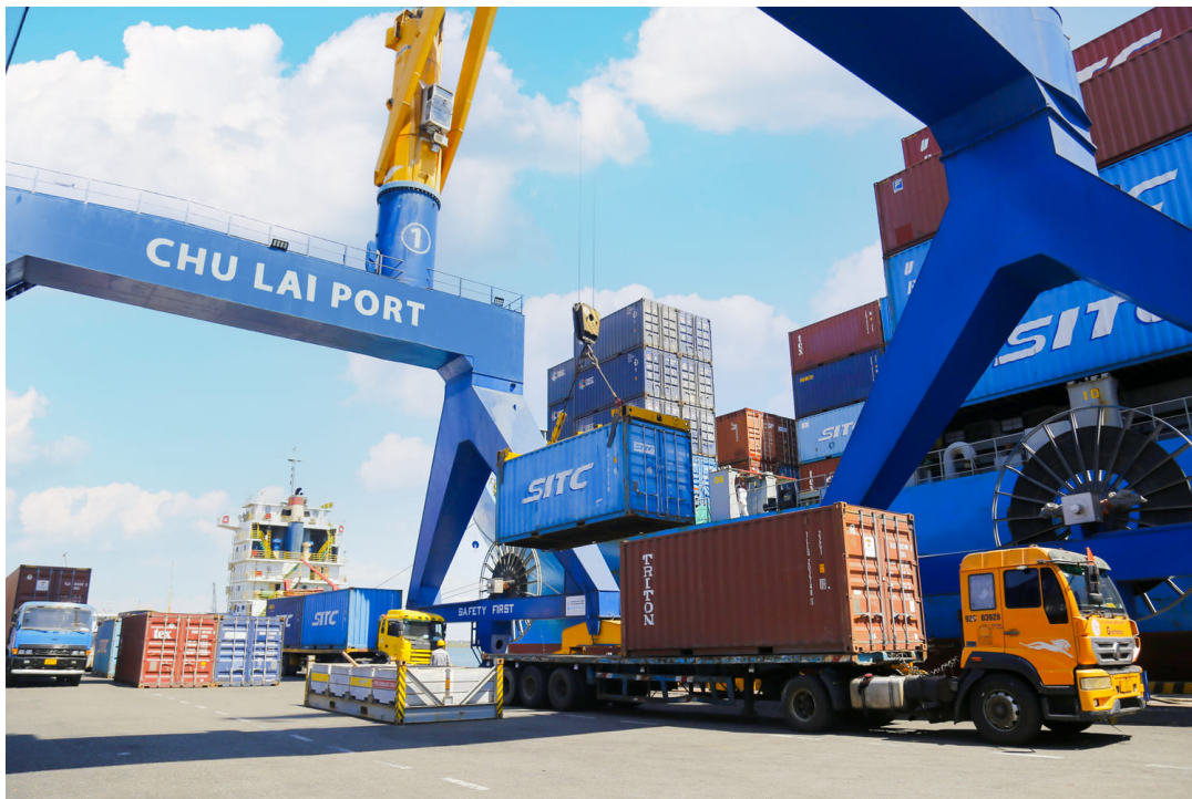
Xếp dỡ hàng hóa tại cảng Chu Lai

Để đảm bảo việc vận hành, khai thác được thông suốt, trong kỳ nghỉ Tết Nguyên Đán, cảng đã phân chia các ca làm việc hợp lý, tổ chức xếp dỡ hàng hóa và giải phóng tàu nhanh chóng, đảm bảo an toàn khai thác hàng hải. Hiện nay, cảng Chu Lai khai thác đa dạng hàng hóa như: hàng container, hàng rời, hàng siêu trường, siêu trọng... với nhiều loại hình dịch vụ chất lượng, chi phí hợp lý, giúp nâng cao năng lực cạnh tranh cho các doanh nghiệp. Năm 2023, phần đầu sản lượng hàng hóa thông qua cảng đạt 4,5 triệu tấn (tăng 15% so với năm 2022) và tiếp tục đầu tư nhiều dự án: xây dựng bến cảng 5 vạn tấn, kho 6A, 7A; lắp đặt các thiết bị xếp dỡ (cầu giàn STS, cầu khung RTG)... dự kiến sẽ hoàn thành và đưa vào vận hành trong năm nay.