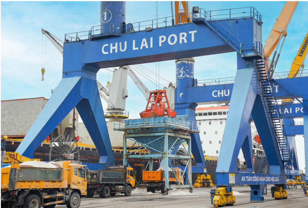
Cảng Chu Lai tiếp nhận và xếp dỡ tàu muối