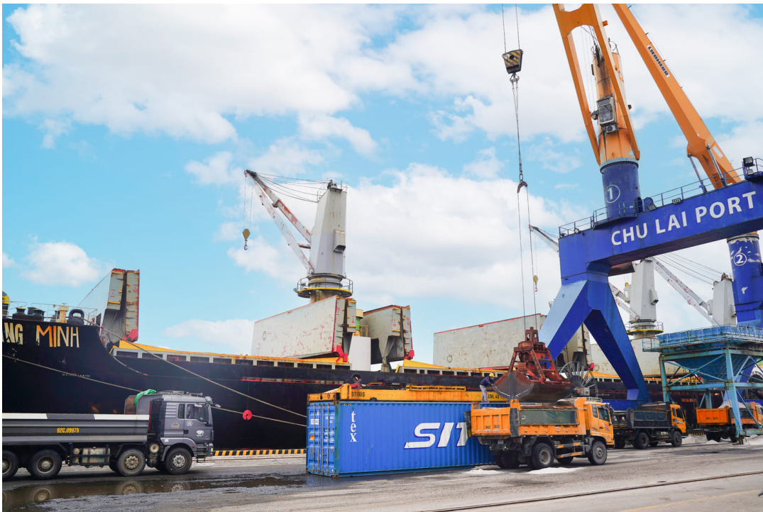
Cảng Chu Lai tiếp nhận và xếp dỡ tàu muối