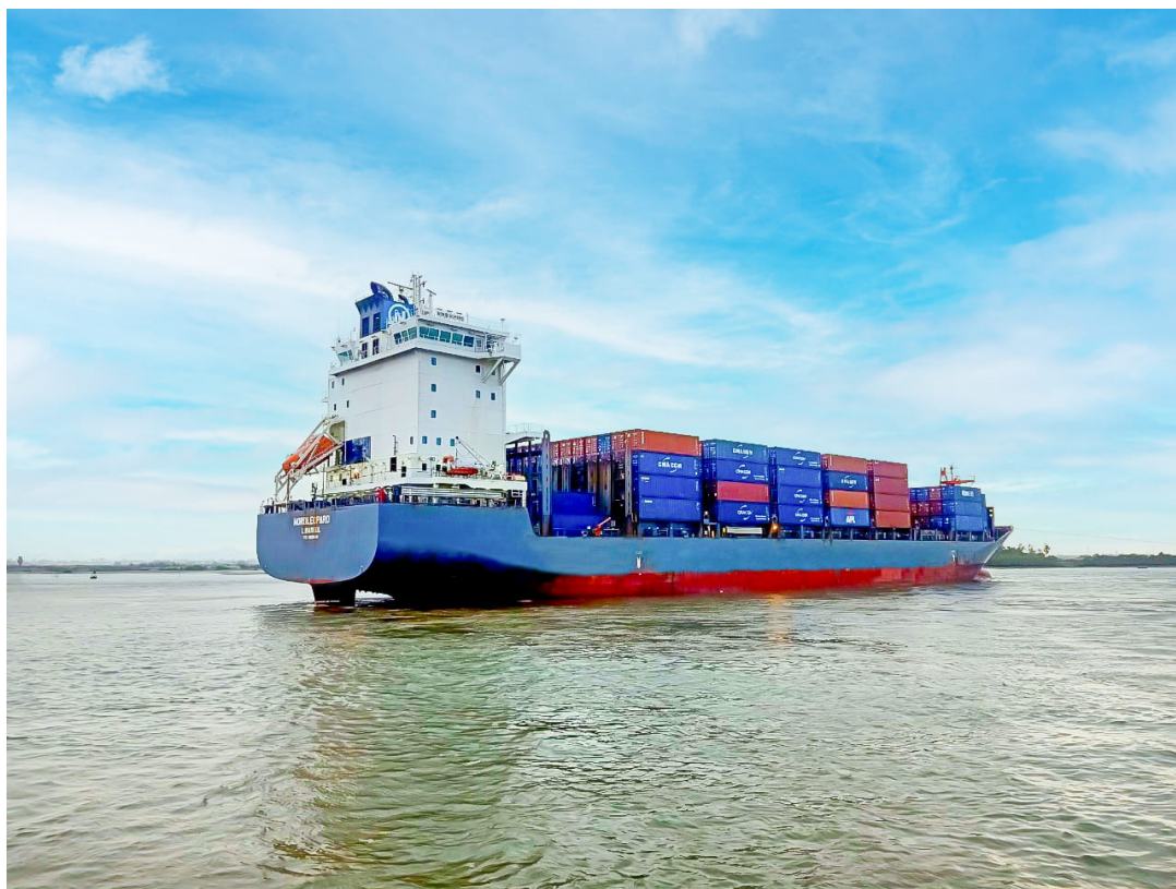
Tàu NORDLEOPARD cập cảng Chu lai

Những ngày trong và sau Tết Nguyên đán Quý Mão 2023, không khí làm việc tại cảng Chu Lai (thuộc THILOGI) rất nhộn nhịp. Những chuyến tàu chở hàng tấp nập ra vào cảng, xếp dỡ hàng hóa là tín hiệu vui dự báo một năm mới tăng trưởng mạnh về logistics phục vụ xuất - nhập khẩu.