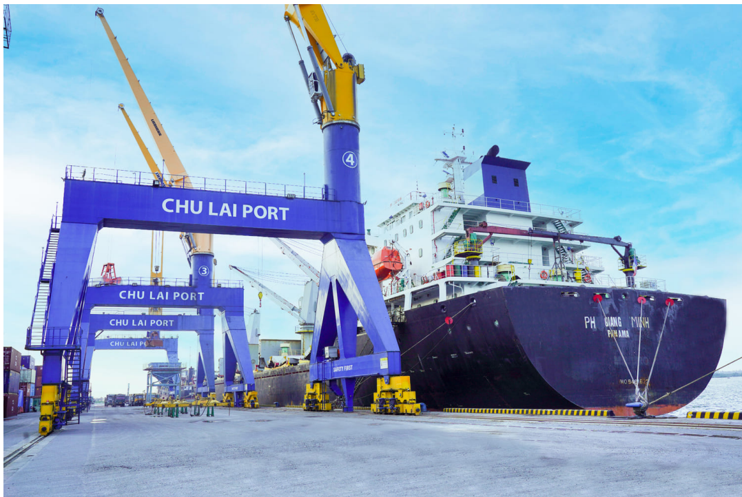
Tàu PH GIANG MINH (Panama) vận chuyển 16.500 tấn muối từ Kandla (Ấn Độ) cập cảng Chu Lai

Mùng 9 Tết (30/01), cảng đã tiếp nhận tàu PH GIANG MINH (quốc tịch Panama) mang theo 16.500 tấn muối trực tiếp từ Kandla (Ấn Độ) cập cảng, cung ứng cho Công ty Cổ phần Thương mại và Sản xuất công nghiệp Việt An. Đây là chuyến tàu có sản lượng hàng lớn nhất mà doanh nghiệp này nhập khẩu qua cảng Chu Lai từ trước đến nay.