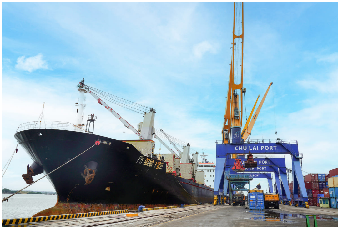
Tàu PH GIANG MINH cập cảng Chu Lai

Mùng 9 Tết (30/01), cảng đã tiếp nhận tàu PH GIANG MINH (quốc tịch Panama) mang theo 16.500 tấn muối trực tiếp từ Kandla (Ấn Độ) cập cảng, cung ứng cho Công ty Cổ phần Thương mại và Sản xuất công nghiệp Việt An. Đây là chuyến tàu có sản lượng hàng lớn nhất mà doanh nghiệp này nhập khẩu qua cảng Chu Lai từ trước đến nay.