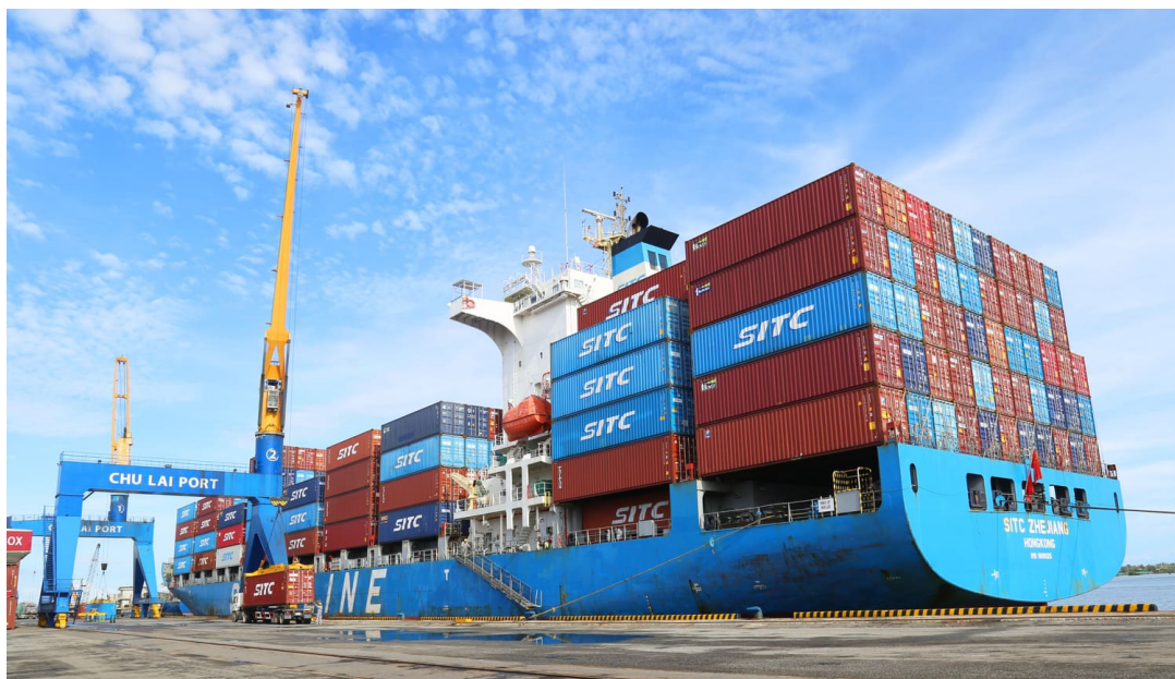
Tàu SITC ZHEJIANG cập cảng Chu Lai

Mùng 2 Tết (23/01), cảng Chu Lai đã đón tàu NORDLEOPARD (sức chứa hơn 1.300 teu) của hãng CMA CGM đến “xông đất”, thực hiện xuất - nhập khẩu gần 600 container hàng hóa, chủ yếu là linh kiện phụ tùng. Những ngày tiếp đó, cảng đã tiếp nhận thêm nhiều tàu lớn như: SITC ZHEJIANG, CNC PLUTO, ISTAR, AN TRUNG 46, HOÀI SƠN 56... vận chuyển chuỗi, linh kiện phụ tùng, tinh bột sắn, hạt nhựa, thiết bị y tế, xi măng, nhựa đường, đá vôi cho các doanh nghiệp tại miền Trung.