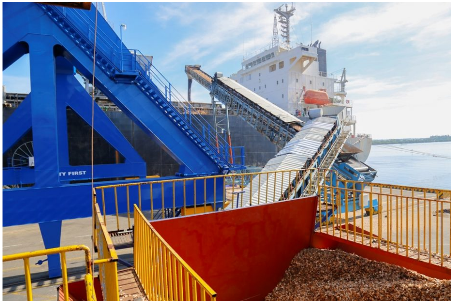
Băng chuyên vận chuyển hàng dăm gỗ lên tàu

Ngày 23/9/2020, lô 16.000 tấn dăm gỗ của Công ty Thanh Thành Đạt đã được xuất khẩu qua cảng Chu Lai (Quảng Nam) để sang thị trường Trung Quốc.